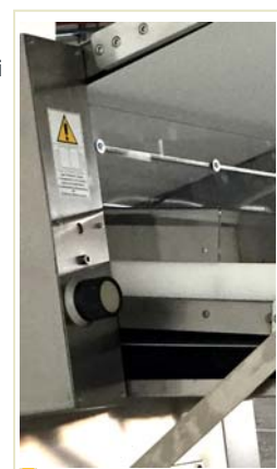
Particolare della manopola di regolazione dello spessore