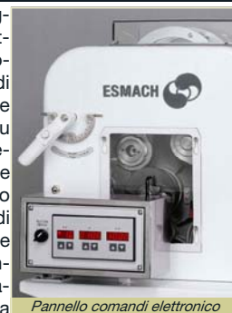
Pannello comandi elettronico