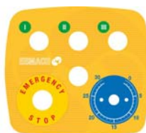
Panel de mandos electromecánico

Los siguientes utensilios están incluidos: batidor de globo de acero inoxidable, pala batidora plana y espiral de aluminio.