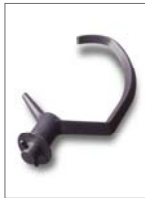
GANCHO DE ALUMINIO O ACERO INOXIDABLE