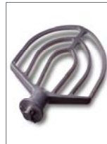
PALA BATID. DE ALUMINIO