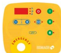
Panel de mandos electrónico 3 velocidades