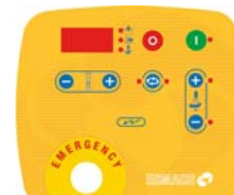
Panel de mandos electrónico velocidad variable