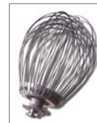
BATIDOR DE GLOBO DE ACERO INOXIDABLE