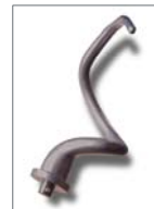
ESPIRAL DE ALUMINIO O ACERO INOXIDABLE