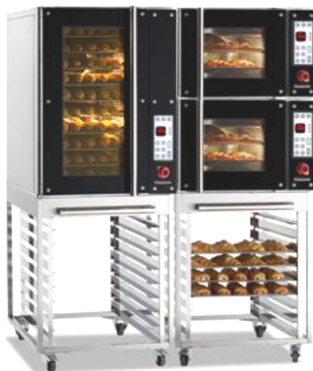
Assieme Krystal 46.4 e 46.10 con supporto standard