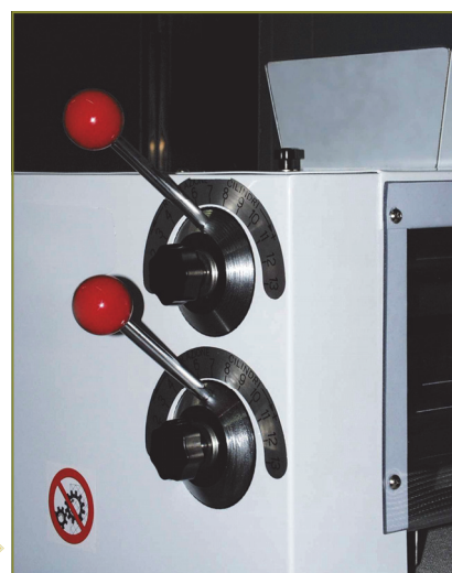
Particolare leve di regolazione dello spessore di laminazione