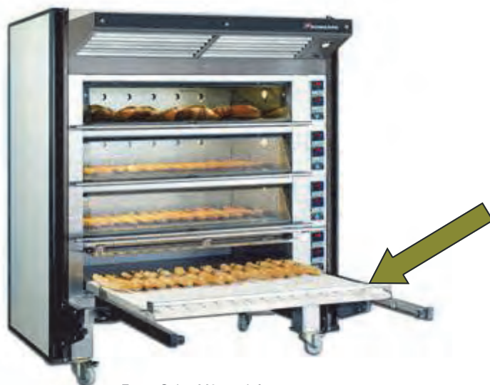
Forno Soleo M6 con informatore