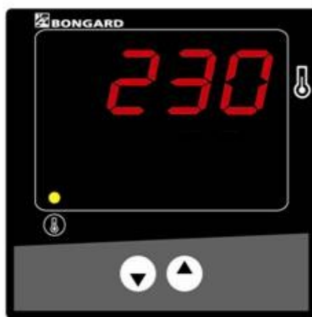
Ergocom senza orologio