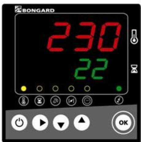
Ergocom con orologio