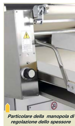
Particolare della manopola di regolazione dello spessore